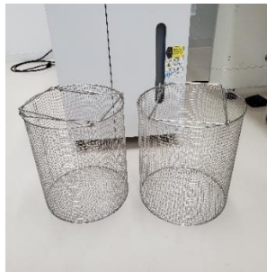
付属品 (ラック・カスト)