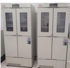
付属品 : 鍵