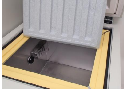
内部（ラック等は付属していません）